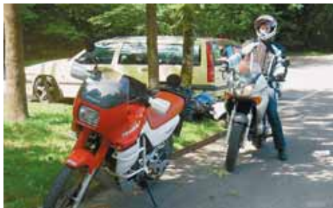
Klein muss beginnen, wer einmal gross rauskommen will: Bringst Du nicht die geeignete Maschine mit, können wir mit unseren helfen!

Sie geht bis zur Führerprüfung, Kat. A1 für Autolenker auch ohne Prüfung. Es gibt vieles, das man nicht im Gruppenunterricht lernen kann: Beispielsweise das Kurvenfahren, Abstände einhalten oder die Maschinenbedienung bis hin zum Schalten. Wer es nicht von Grund auf richtig lernt, hat später viel mehr Mühe, falsche Verhaltensmuster zu ändern. Etwa 50 Prozent meiner heutigen Kundschaft haben ihre obligatorische Grundausbildung in einer anderen Fahrschule gemacht. Nur ganz wenige davon haben dort wirklich etwas Positives für ihre Laufbahn mitgenommen! Bei den meisten beginnt es schon bereits mit dem Fahren zu zweit beim Anhalten und Fuss abstellen: Ohne Konzept kippen wir mal nach links, mal nach rechts, meistens verbunden mit einem harten Bremsnicken! Ohne das Können und Bewältigen dieser Grundlagen kommt bei mir jemand schon erst gar nicht in den Gruppenkurs.