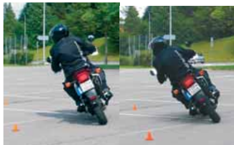
Weiterbringen sind bei uns nicht leere Worte: Wir holen Dich da ab, wo Du stehst und bringen Dich auch individuell weiter! Links bei Beginn, rechts 7 Minuten später!

Das gibt es bei mir seit 1985, als ich als Schlussarbeit im SMFV-Instruktorenkurs das Thema «Frühlingseinfahrkurs» bearbeitete: Seither haben sich meine Weiterbildungskurse stets weiterentwickelt und dank der grossen Erfahrung, auch in der Weiterbildung für Motorradfahrlehrer, gelingt es mir immer wieder, lernwillige Teilnehmer zu begeistern! Wie in der Einzelausbildung möchte ich mit jedem Teilnehmer bis zum Abend ein persönliches Lernziel erreichen, sei es im Umgang mit seiner schweren Maschine, die dabei etwas leichter wird, beim engen Wenden im Langsamfahrbereich, beim Fahren im Realverkehr. Dafür bin ich berühmt bis weit über die Landesgrenzen hinaus, seit mehr als 20 Jahren kommen immer wieder Gruppen aus Deutschland zu mir in die Weiterbildung. Dabei werde ich durch mein langjähriges Instruktorenteam unterstützt, die auch mal bei mir als Kandidaten begonnen hatten.