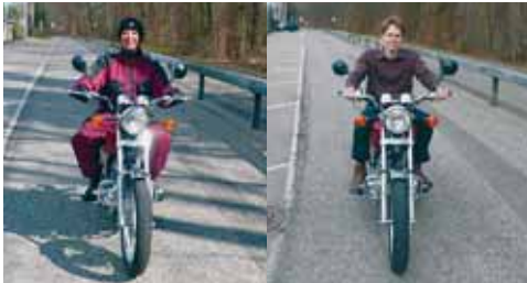
Ohne eigenes Motorrad und ohne Lernfahrausweis schnuppern – beim Profi mit der grössten Erfahrung!

Wer noch nie mit einem Motorrad gefahren ist, darf laut unserem Gesetz unbegleitete Lernfahrten mit seinem Lernfahrausweis unternehmen. Da bis ins Jahr 2003 dies nur mit Maschinen oder Rollern von maximal 125 Kubik Hubraum geschah, führte dies auch kaum zu Problemen in der Praxis: Kein Mensch kam auf die Idee, jemanden direkt auf eine 250 Kilogramm schwere Maschine zu setzen, höchstens mal auf einem Feldweg oder einem Parkplatz – weit, weit weg von jeglichem Verkehr. Aus Erfahrung beginne ich mit jeder Person auf einer kleinen, unproblematischen 125er-Maschine, und dies seit meinen ersten Anfängen 1982 auf einer Honda CM 125 C. Selbst auf dieser, nur 145 Kilogramm schweren Maschine sind vor allem kleinere und leichtere Personen gefordert. Nach den ersten Fahrerfahrungen versuchen wir es dann mal mit einer etwas grösseren Maschine in der Mittelklasse.