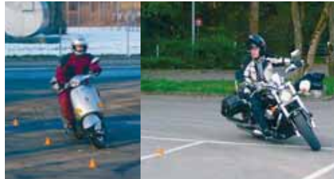
Angst abbauen vor der Schräglage, der grossen Maschine – gleich zu Beginn: Angst ist ein schlechter Begleiter!

Seit es die obligatorische Grundausbildung auch für die schwereren Maschinen, und damit das direkte Einsteigen auf diese ohne Umweg über die 125er-Klasse gibt, erlebe ich viel, ab und zu auch zuviel! Viele Anfänger sind hoffnungslos überfordert und lassen ihre Maschine fallen, oder noch gefährlicher: Sie stürzen und bringen auch andere Mitlernende in Gefahr! Nur mit viel Glück ist bis zum heutigen Tag nie etwas schlimmeres passiert. Geduld ist nicht die Stärke vieler Anfänger. Will man aber gefahrlos das Töfffahren erlernen – allein dieses ist ja schon gefährlich genug –, dann muss man geduldig Schritt um Schritt, «step by step» vorwärts gehen, wie beim Bergsteigen: Einmal keinen festen Tritt unter dem Fuss und der Absturz ist vorprogrammiert. Bei uns gibt es keine Minimalausbildung im Gruppenunterricht, und dies «aus guter Erfahrung»!