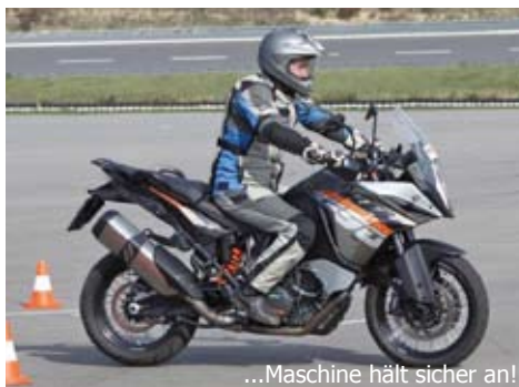
...Maschine hält sicher an!