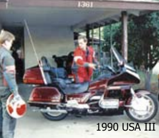
1990 USA III