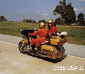
1986 USA II