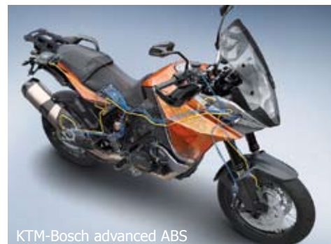
KTM-Bosch advanced ABS