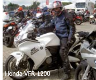
Honda VFR 1200