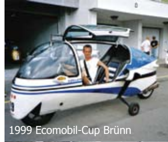
1999 Ecomobil-Cup Brünn