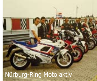
Nürburg-Ring Moto aktiv