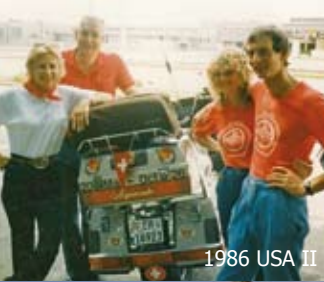
1986 USA II