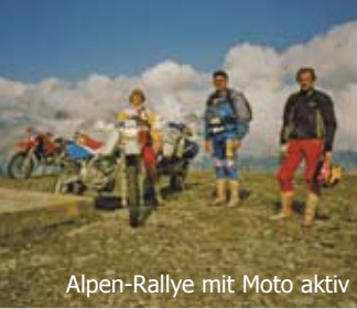
Alpen-Rallye mit Moto aktiv