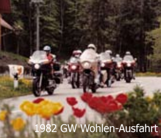
1982 GW Wohlen-Ausfahrt