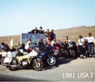
1981 USA I