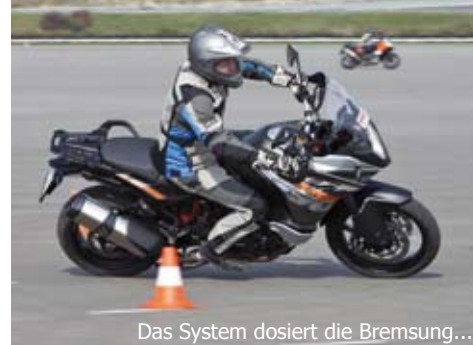
Das System dosiert die Bremsung...