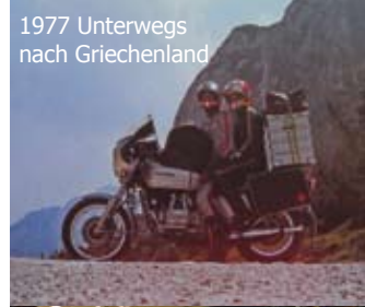
1977 Unterwegs nach Griechenland

Innerhalb meiner Tätigkeit als Fahrlehrer konnte ich praktisch alles fahren, was es so gibt. Ich hatte Spass, mit welcher Maschine, vom 50 Kubik-Scooter bis zum 2-Liter-Chopper, auch immer ich fuhr: Hauptsache es hat 2 Räder! Oder, höchstens das dritte Rad in einer Linie, wie bei meiner 1000er-GoldWing mit Einradanhänger. Seitenwagen war nie ein Thema, erstens hatte ich viel Respekt vor dem «so-andersartigen Gefährt», welches genau das Gegenteil fährt was man als Solofahrer erwartet, und zweitens geniesse ich die G-Beschleunigung, welche mich bei schneller Kurvenfahrt in den Sattel drückt. Mich am Lenker zu halten, dass ich nicht vom Gefährt runterfalle, war mir zu anstrengend. Und so