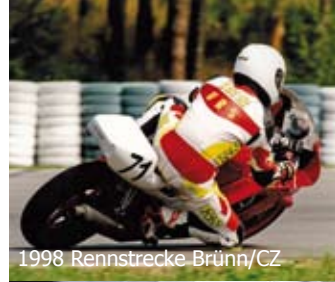
1998 Rennstrecke Brünn/CZ