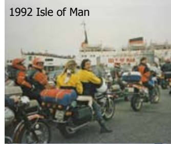
1992 Isle of Man