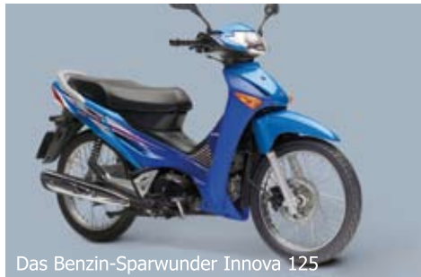
Das Benzin-Sparwunder Innova 125

NC-Modellen, die mit einem «halben» Civic-(Auto)Motor ausgerüstet sind, ging Honda einen neuen Weg: Sie nahmen die viel weiter entwickelte Autotechnologie direkt hinüber in einen Zweiradrahmen. Und sie erreichten, zusammen mit einer langen Gesamtübersetzung, sensationell niedrige Verbräuche – allerdings verbunden mit einer wenig spektakulären Kraftentwicklung, was je nach Einstellung beim Fahrer nicht die grossen Emotionen weckt. Das mit dem Doppelkupplungsgetriebe kombinierbare Aggregat ist gerade für jene, die einfach eine Fahrmaschine mit wenig Fahreraktivität suchen, wie sie im Integra-Roller optimal serienmässig mit einem guten Fahrtwind- und Wetterschutz zur Verfügung gestellt wird, ein umweltschonender und zukunftsweisender Alltagsbegleiter. Dies hat selbst bei den sportlich orientierten Journalisten Neugier geweckt, was damit, ohne auf Fahrspass zu verzichten, alles möglich ist. In Motorrad 20/2013