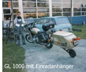
GL 1000 mit Einradanhänger