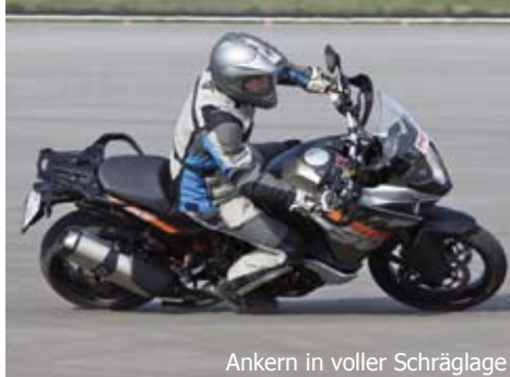
Ankern in voller Schräglage