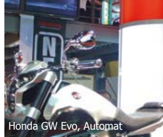
Honda GW Evo, Automat