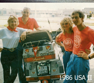
1986 USA II