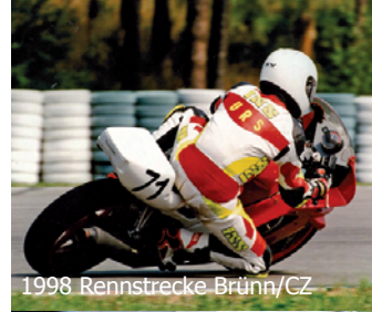
1998 Rennstrecke Brünn/CZ