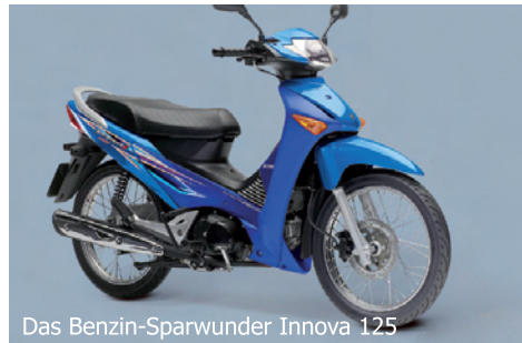
Das Benzin-Sparwunder Innova 125

NC-Modellen, die mit einem «halben» Civic-(Auto)Motor ausgerüstet sind, ging Honda einen neuen Weg: Sie nahmen die viel weiter entwickelte Autotechnologie direkt hinüber in einen Zweiradrahmen. Und sie erreichten, zusammen mit einer langen Gesamtübersetzung, sensationell niedrige Verbräuche – allerdings verbunden mit einer wenig spektakulären Kraftentwicklung, was je nach Einstellung beim Fahrer nicht die grossen Emotionen weckt. Das mit dem Doppelkupplungsgetriebe kombinierbare Aggregat ist gerade für jene, die einfach eine Fahrmaschine mit wenig Fahreraktivität suchen, wie sie im Integra-Roller optimal serienmässig mit einem guten Fahrtwind- und Wetterschutz zur Verfügung gestellt wird, ein umweltschonender und zukunftsweisender Alltagsbegleiter. Dies hat selbst bei den sportlich orientierten Journalisten Neugier geweckt, was damit, ohne auf Fahrspass zu verzichten, alles möglich ist. In Motorrad 20/2013