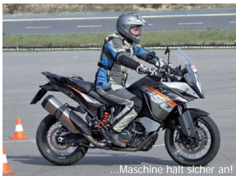
...Maschine hält sicher an!