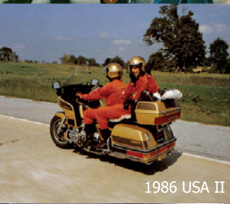
1986 USA II