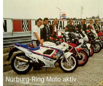
Nürburg-Ring Moto aktiv