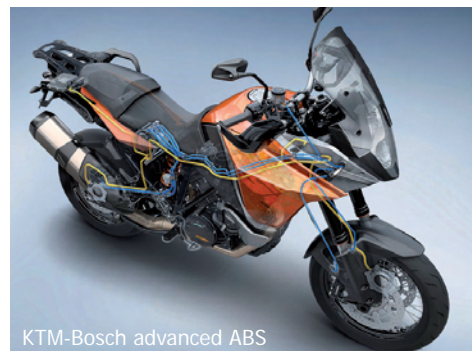
KTM-Bosch advanced ABS