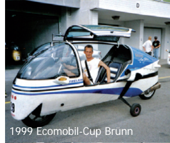
1999 Ecomobil-Cup Brünn