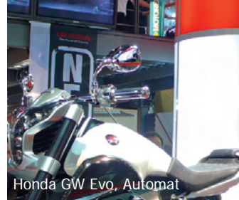
Honda GW Evo, Automat