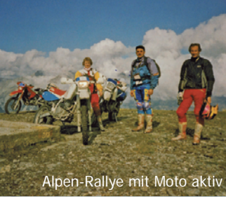
Alpen-Rallye mit Moto aktiv