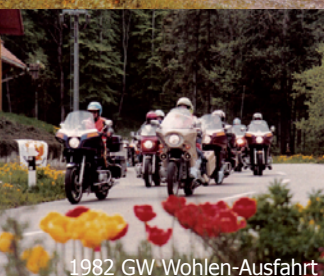
1982 GW Wohlen-Ausfahrt