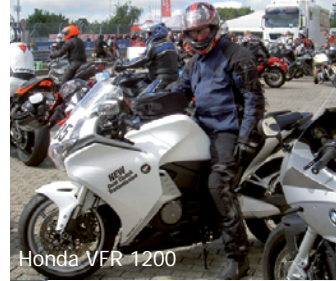
Honda VFR 1200