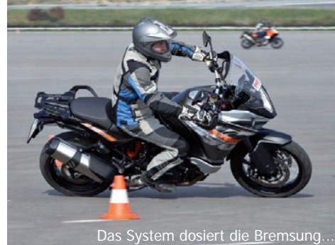
Das System dosiert die Bremsung...