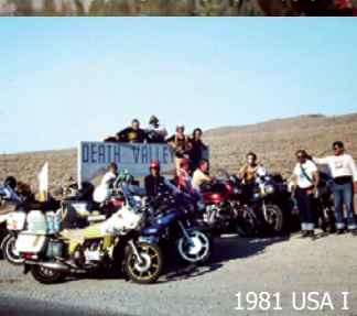
1981 USA I