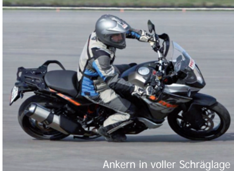
Ankern in voller Schräglage