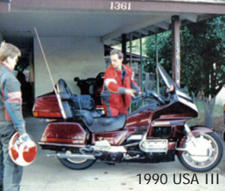
1990 USA III