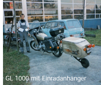
GL 1000 mit Einradanhänger