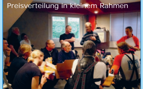
Preisverteilung in kleinem Rahmen

Der 1. Mai 2011 ist ein ganz besonderer: Zum 20. Mal organisiere ich diese Rallye! Die wenigen Teilnehmer von 2011 haben sich bereit erklärt, diese Jubiläums-Rallye tatkräftig mitzugestalten. Sie findet diesmal an einem Sonntag statt. Vielleicht dürfen wir deshalb mit einer Teilnehmerzahl wie früher rechnen?!? Reserviere dir jetzt schon dieses Datum.