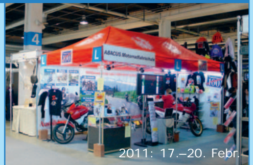
2011: 17.–20. Febr.

Die SWISS-MOTO 2010 fand vom 18. bis 21. Februar statt. Sie ist inzwischen als Auftakt der neuen Töff-Freaksaison ein Muss für jeden Töff-Freak! Abgesehen davon, dass infolge des alljährlichen Turnus (früher nur alle 2 Jahre) nicht mehr regelmässig alle in der Branche mitmachen, z. Bsp. fehlt Yamaha, bietet sie viel «Fun, Show und Action»!